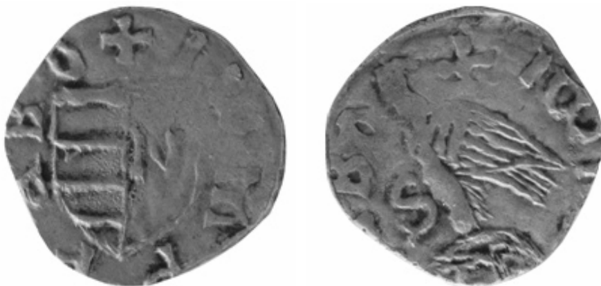
Fig. 1. Ducat de la Mircea cel Bătrân, cu legenda și sigla inedite (imagine mărită)