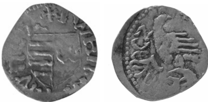
Fig. 2. Ducat de la Mircea cel Bătrân (imagine mărită)