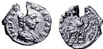
Fig. 1. Monedă emisă de Elagabalus pentru Iulia Soaemias, cu tăietură ( apud Ioniță et alii 2004, p. 65, nr. 13)

arată că dacă nu toate, cel puțin cinci exemplare au fost găsite în cu totul altă poziție stratigrafică decât cea în care ar fi trebuit să se afle în mod natural.