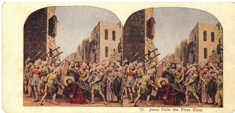
Fig. 13. Iisus prăbușit prima oară (colecția Remus Baciu)