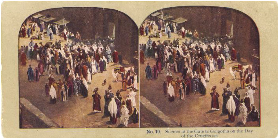
Fig. 3. Scene de pe drumul Golgotei în ziua Crucificării (colecția Marieta Tecșa)