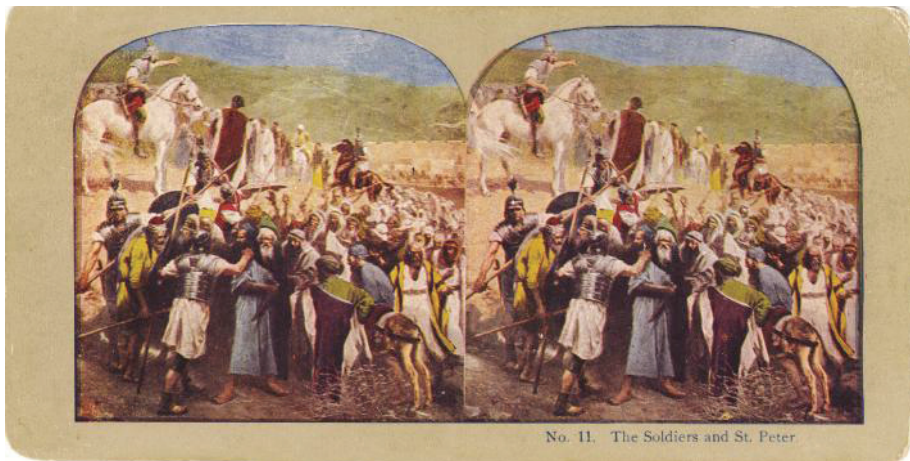
Fig. 4. Soldații și Sf. Petru (colecția Marieta Tecșa)