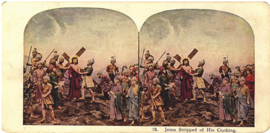
Fig. 15. Hainele lui Hristos trase la sorți (colecția Remus Baciu)