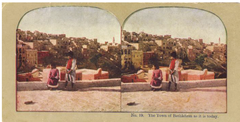
Fig. 10. Orașul Bethlehem așa cum este astăzi