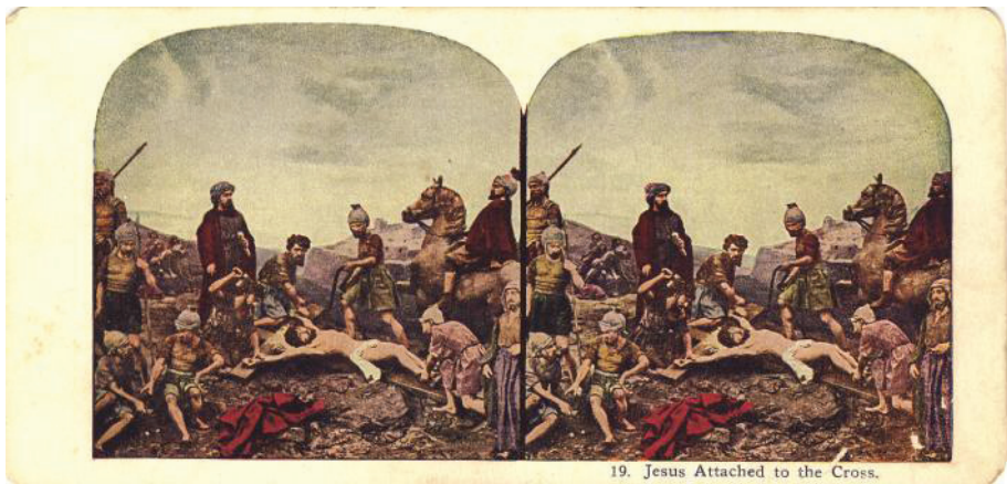
Fig. 16. Iisus pus pe cruce (colecția Remus Baciu)