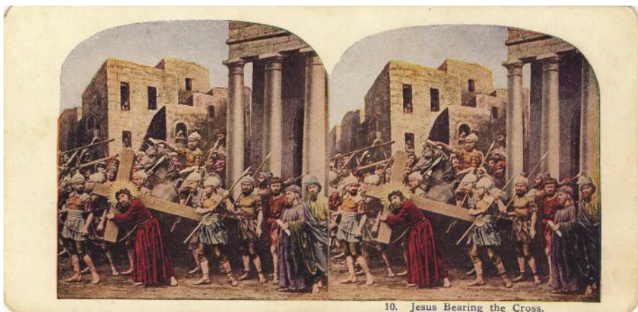
Fig. 12. Iisus ducând crucea (colecția Remus Baciu)