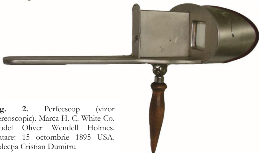
Fig. 2. Perfecscop (vizor stereoscopic). Marca H. C. White Co. Model Oliver Wendell Holmes. Datare: 15 octombrie 1895 USA. Colecția Cristian Dumitru