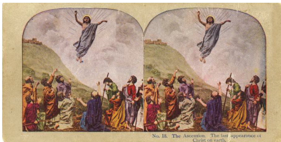
Fig. 9. Înălțarea Domnului. Ultima apariție a lui Hristos pe pământ (colecția Marieta Tecșa)