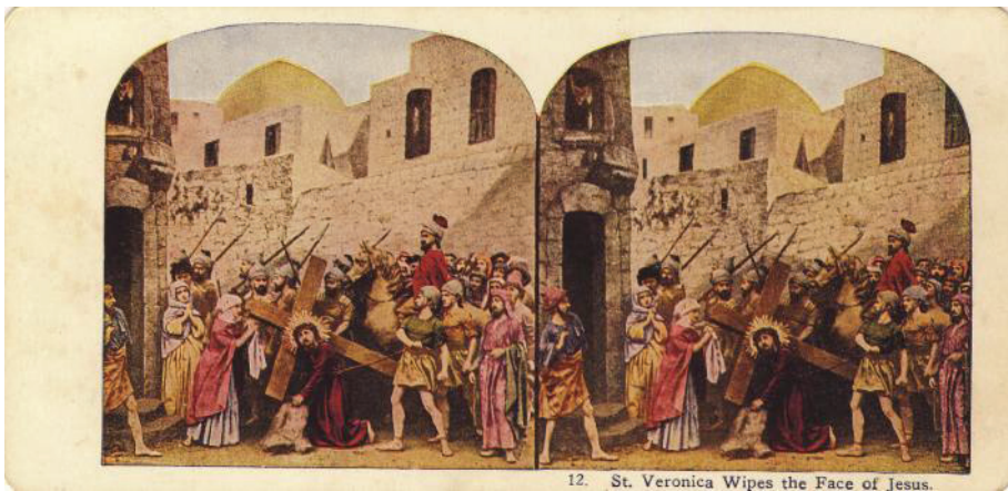
Fig. 14. Sf. Veronica ștergând fața lui Iisus (colecția Remus Baciu)