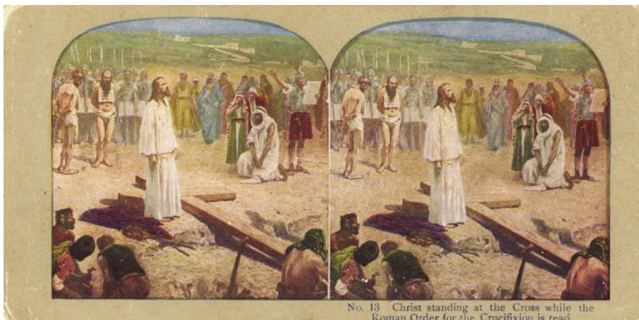
Fig. 6. Hristos stând la Cruce în timp ce este citit ordinul de crucificare (colecția Marieta Tecșa)