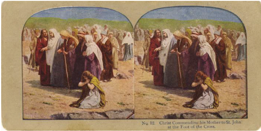
Fig. 5. Hristos încredințându-și Mama Sfântului Ioan, la picioarele Crucii (colecția Marieta Tecșa)