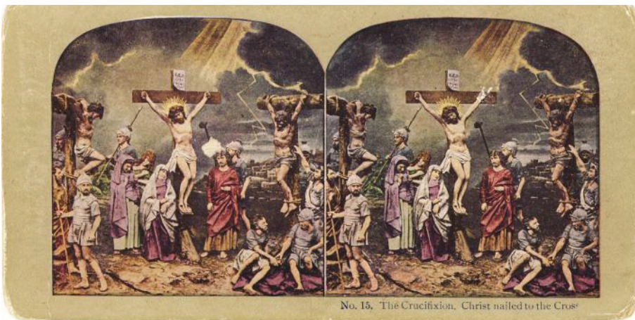
Fig. 8. Răstignirea. Hristos răstignit (colecția Marieta Tecșa)