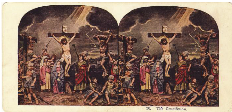
Fig. 17. Răstignirea (colecția Remus Baciu)