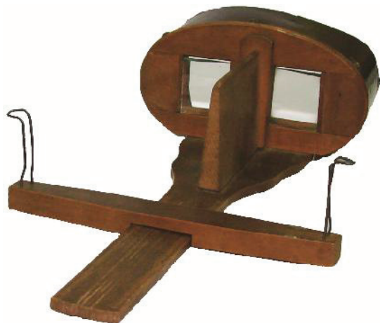
Fig. 1. Stereoscop (vizor stereoscopic). Model Oliver Wendell Holmes. Datare: 1898. Colecția Alexandru Bucur