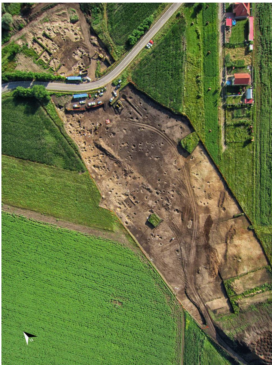
Fig. 6. Vedere aeriană asupra Zonei 3 la finalul cercetării. Se observă cele trei șanțuri paralele la extremitatea de sud, parțial golite, culoarea închisă din zona centrală și de nord-est, ce reprezintă arealul cel mai jos altimetric, unde a fost prezent fenomenul înmlăștinării