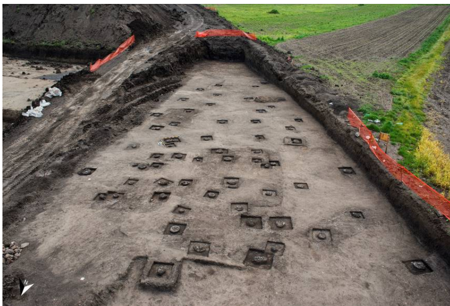
Fig. 5. Vedere generală spre sud asupra necropolei din epoca bronzului (cultura Wietenberg, faza II)

Necropola de incinerare Wietenberg a fost un alt element de noutate, aceasta fiind cercetată în extremitatea de sud-vest a Zonei 3 . Judecând după modul de dispunere al urnelor funerare, după frecvența acestora, este de bănuț că doar jumătate din necropolă a fost surprinsă pe amprenta proiectului, ea continuând spre vest, în afara amprizei autostrăzii ( fig. 5 ). Proasta conservare a urnelor funerare se datorează, probabil, ceramicii de slabă calitate din care acestea au fost confecționate.