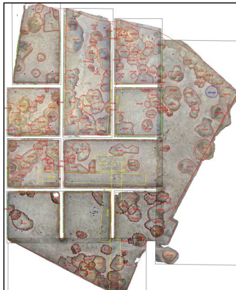
Fig. 4. Referențiere a complexelor (fotogrammetrie) cu coordonatele topografice a sectorului Bordane cu precizarea complexelor cercetate adâncite în sterilul arheologic, a vechilor unități de cercetare (cu galben) și a marilor stratigrafici inițiali