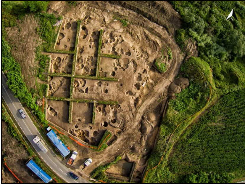
Fig. 3. Fotografie aeriană a Sectorului A: Bordane (central) și Vărăria (dreapta sus), realizată cu drona, înainte de demontarea marilor stratigrafici