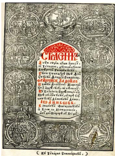
Fig. 1. Strastnic , Blaj, 1804

Acestor două exemple de titluri inexistente li se pot alătura și altele, dar pentru a ne pronunța cu certitudine asupra existenței sau inexistenței tipăriturilor respective trebuie cercetate depozitele deținătoare de carte veche semnalate în literatura de specialitate, precum și exemplare din colecțiile private care ar putea la un moment dat să dezvăluie adevărul.