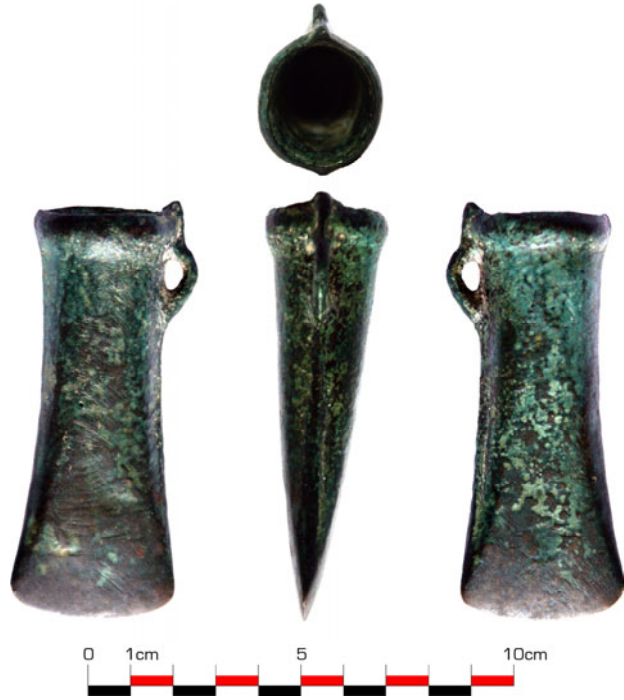
Fig. 1a. Celt din bronz de tip transilvănean de la Bozeș (foto)