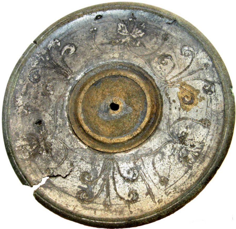
Fig. 2. Falera de la Sarmizegetusa Regia