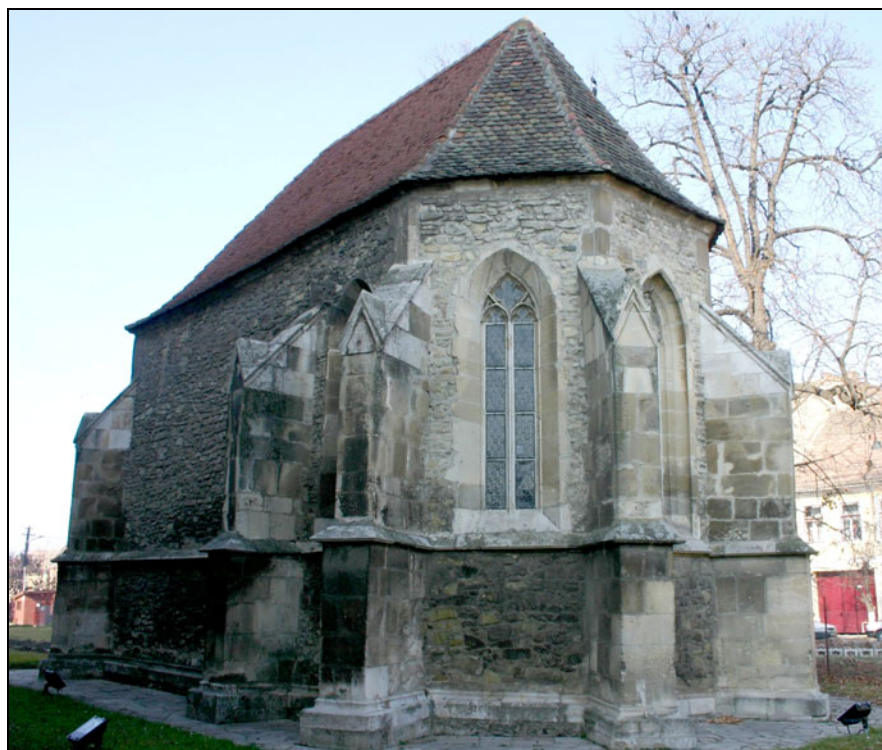
Fig. 3. Capela Sf. Iacob – exterior