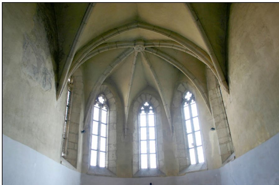
Fig. 2. Capela Sf. Iacob – interior